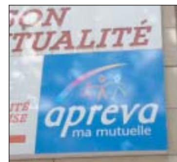
APREVA a amélioré la qualité de son accueil téléphonique.

Le choix du prestataire s'est porté sur ATTI, filiale du groupe TR Services, présent dans le Nord à travers l'agence d'Arras, regroupant une quarantaine de collaborateurs. La mise en place de la nouvelle architecture, basée sur une solution de communications AS-TRAA 5 000, permet de réduire sensiblement les temps d'attente et d'améliorer la qualité de l'accueil téléphonique de ses six cent mille et quelques adhérents. ■