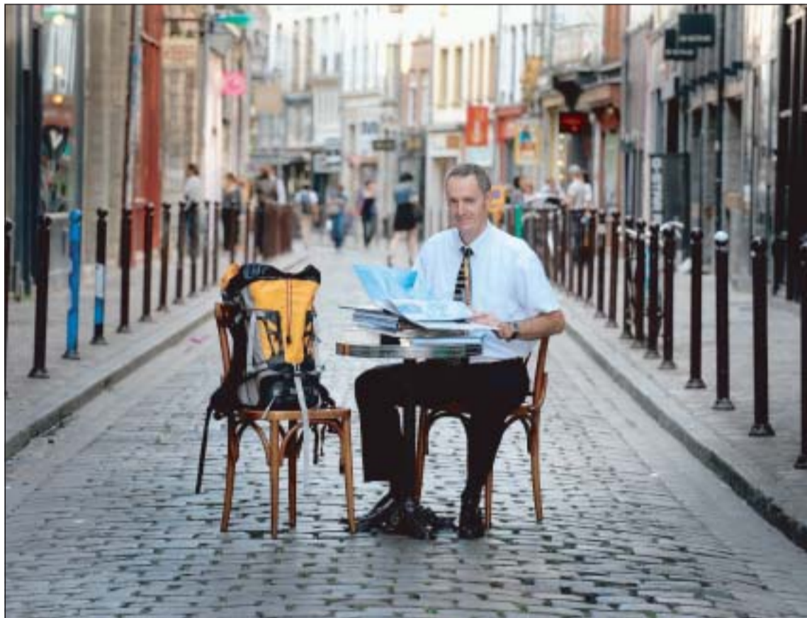
Attention, l'environnement est dans la rue ! Ici à Lille avec ses livres de montagne.